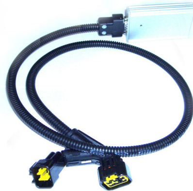
TK 3 DN 1