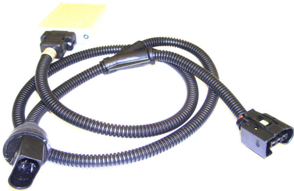
TK 2 BMW 2