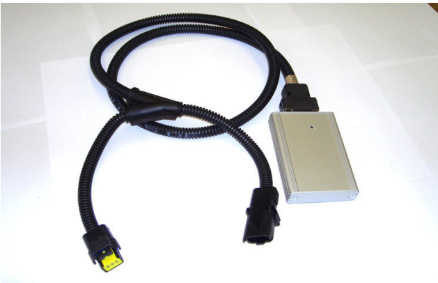
TK 3 BO