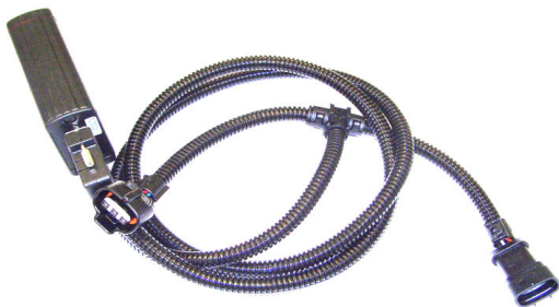
TK TOY 3